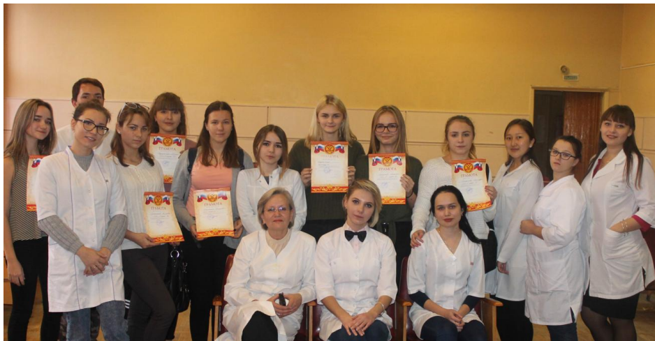
Рис. 1. Участники интерактивного мероприятия в СОШ № 9 "Здоровый образ жизни – выбор современной молодежи"

сердечно-сосудистой системы. Фотография с акции "НЕТ инсульт", проводимой ГБУЗ ГKB № 3 поликлиникой № 3 г. Волжского, в которой участвовали студенты филиала колледжа, представлена на рисунке 2.