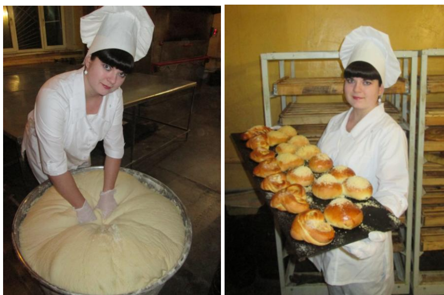
Рис. 1 Производственная практика по профессии «Повар, кондитер»

Система социального партнерства и развитие сетевого взаимодействия между партнерами в ГБПОУ «ПУ № 58» имеет общую цель - обеспечение возможности освоения обучающимися ОПОП с использованием ресурсов организаций, осуществляющих образовательную деятельность, а также использование ресурсов иных образовательных организаций - социальных партнеров.