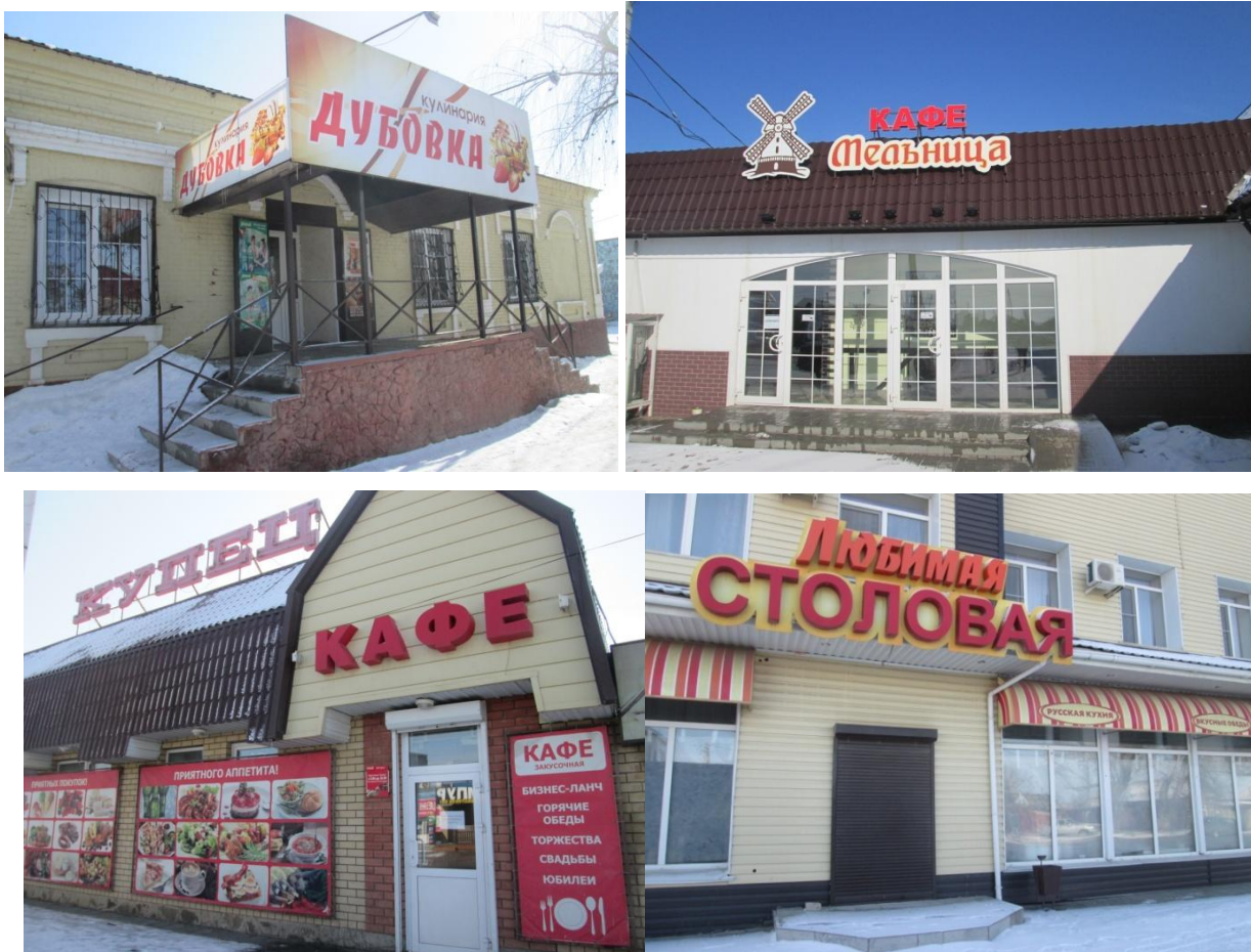
Рис. 2. Предприятия общественного питания

Взаимодействие обучающихся училища с работодателями в заявленном поле деятельности помогает: оптимизировать затраты на подготовку кадров, - повысить эффективность использования ресурсов, повысить качество подготовки специалистов, востребованных на рынке инновационной экономики. Социальное партнерство техникума, организаций и предприятий представлено различными формами взаимодействия: производственная практика студентов, экспертиза в ходе итоговой аттестации выпускников, стажировка педагогов, экскурсии на предприятия, участие в корректировке учебных программ, научно-практических конференциях, социальных проектах, праздничных, волонтерских и спортивно-оздоровительных мероприятиях.